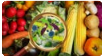
Public : Généralistes et autres spécialistes