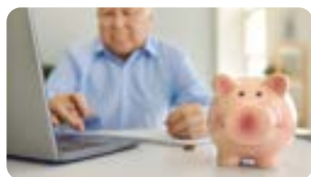
Public : Généralistes et autres spécialistes