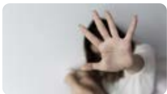
Public : Médecin généraliste et autres spécialistes