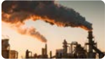
Public : Généralistes et autres spécialistes