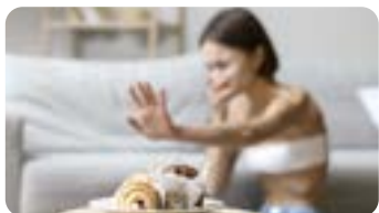
Public : Généralistes et autres spécialistes