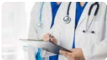
Public : Généralistes et autres spécialistes