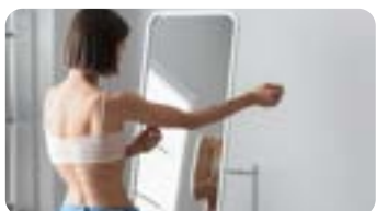
Public : Médecin spécialisé en psychiatrie