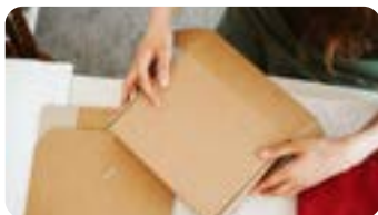
Public : Généralistes et autres spécialistes