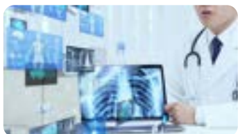
Public : Médecins généralistes