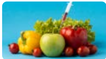
Public : Généralistes et autres spécialistes